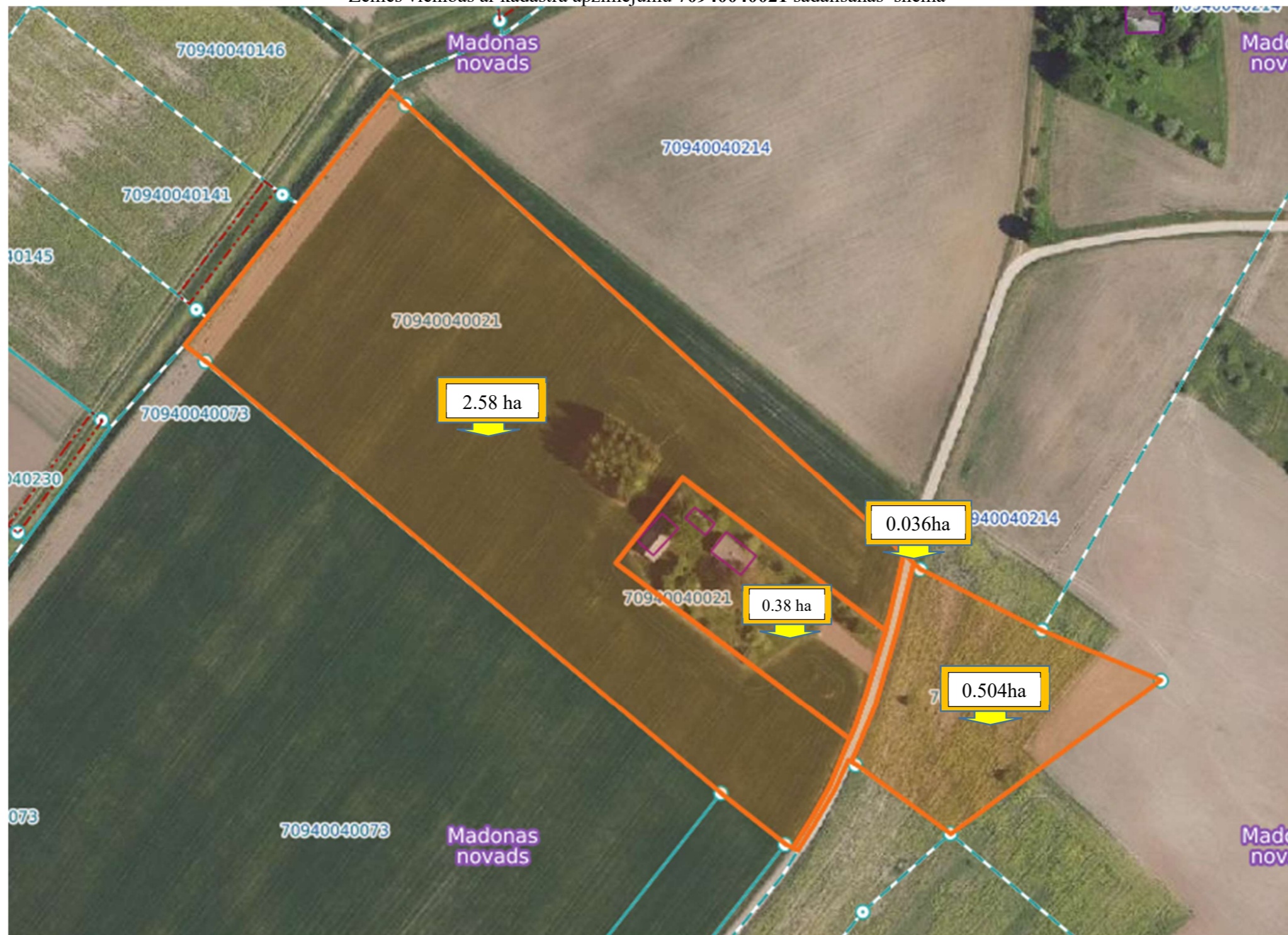
Zemes vienības ar kadastra apzīmējumu 70940040021 sadalīšanas shēma*

Datu avots: https://www.lvmgeo.lv/kartes 2026. gada informācija